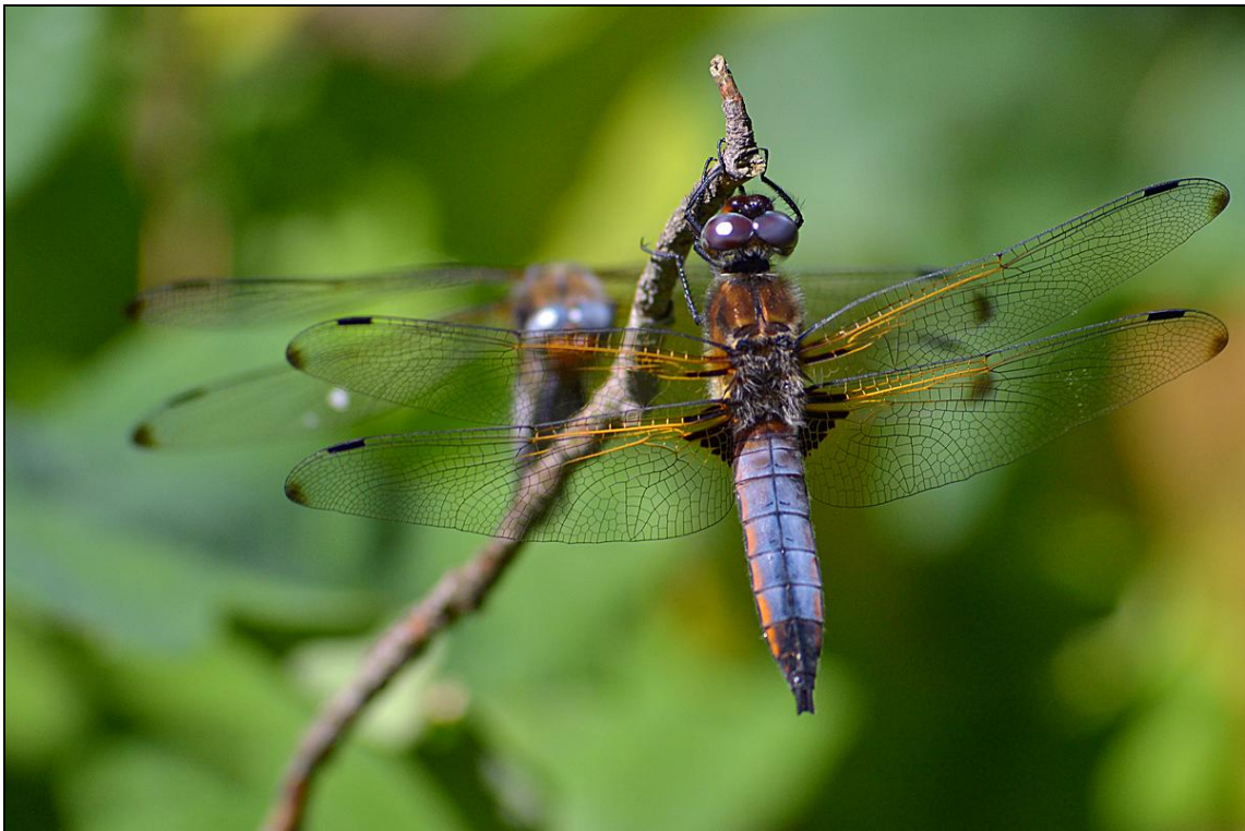
Para Libellula fulva – 18 06 2017 r. Libellula fulva pair – 18 06 2017