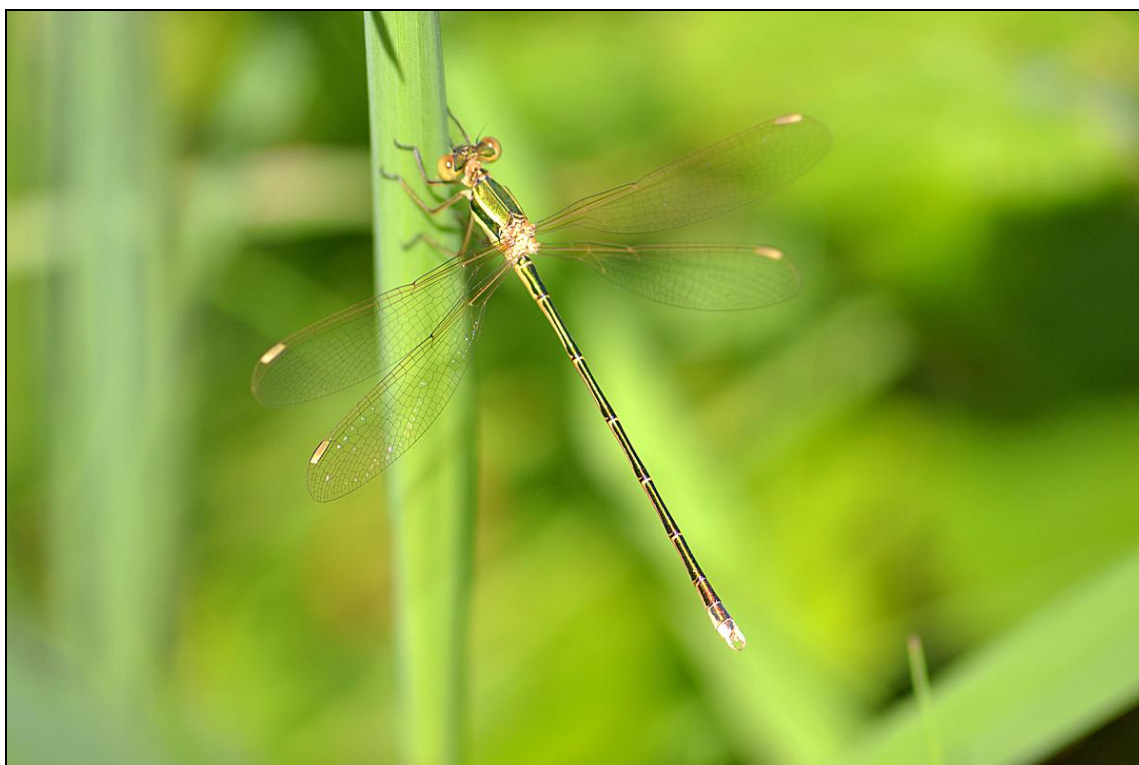
Samiec Lestes barbarus – 10 06 2017 r. Lestes barbarus male – 10 06 2017