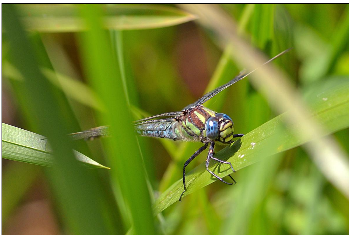
Samiec Brachytron pratense – 03 06 2017 r. Brachytron pratense male – 03 06 2017