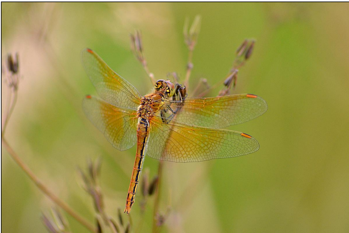
Samica Sympetrum flaveolum – 14 07 2017 r. Sympetrum flaveolum female – 14 07 2017