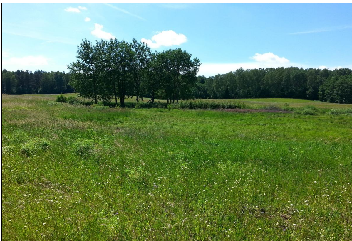
Fot. 1 Zbiornik od strony wschodniej. Lato 2017 Photo 1 The pool from the east. Summer 2017

Stanowisko/Teren. Badany zbiornik śródłąkowy położony jest na zachód od miejscowości Kajny. UTM: DE56 ; współrzędne: 53.847727, 20.360507 (Ryc.1). Mezoregion: Pojezierze Olsztyńskie (SOLON I IN. 2018), 117 m n.p.m. Tereny wokół niego to nieużytkowane od 4 lat łąki (Fot. 1-2).