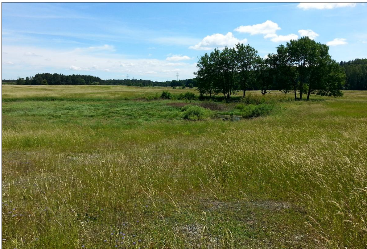
Fot. 2 Zbiornik od strony północnej. Lato 2017 Photo 2 The pool from the north. Summer 2017