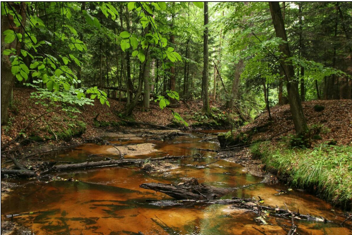
Ryc. 2. Rzeka Dębowiec w okolicach Lipowca. Fig. 2. The River Dębowiec near Lipowiec.

Obserwacje z 2022 roku są potwierdzeniem wcześniej stwierdzonego występowania C. boltonii w tym rejonie – rz. Łukawica (UTM EB81 i EB71) (Ryc. 1) (BUCZYŃSKI, ŁABĘDZKI 2012).